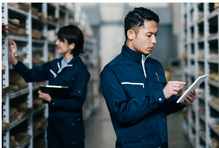
<Joboco 利用イメージ写真>